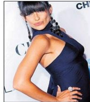
Nelly Furtadon viime vuonna julkaistu levy Loose on myynyt Suomessa noin 7 000 kappaletta.